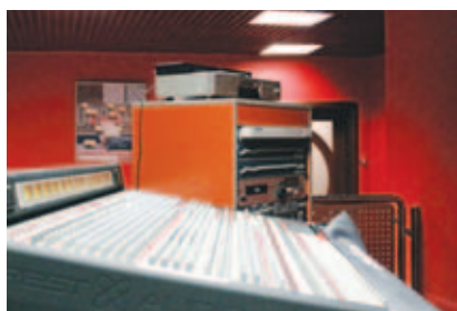
В студии телеканала

ратор – компания «Триколор ТВ») и в интернет-формате.