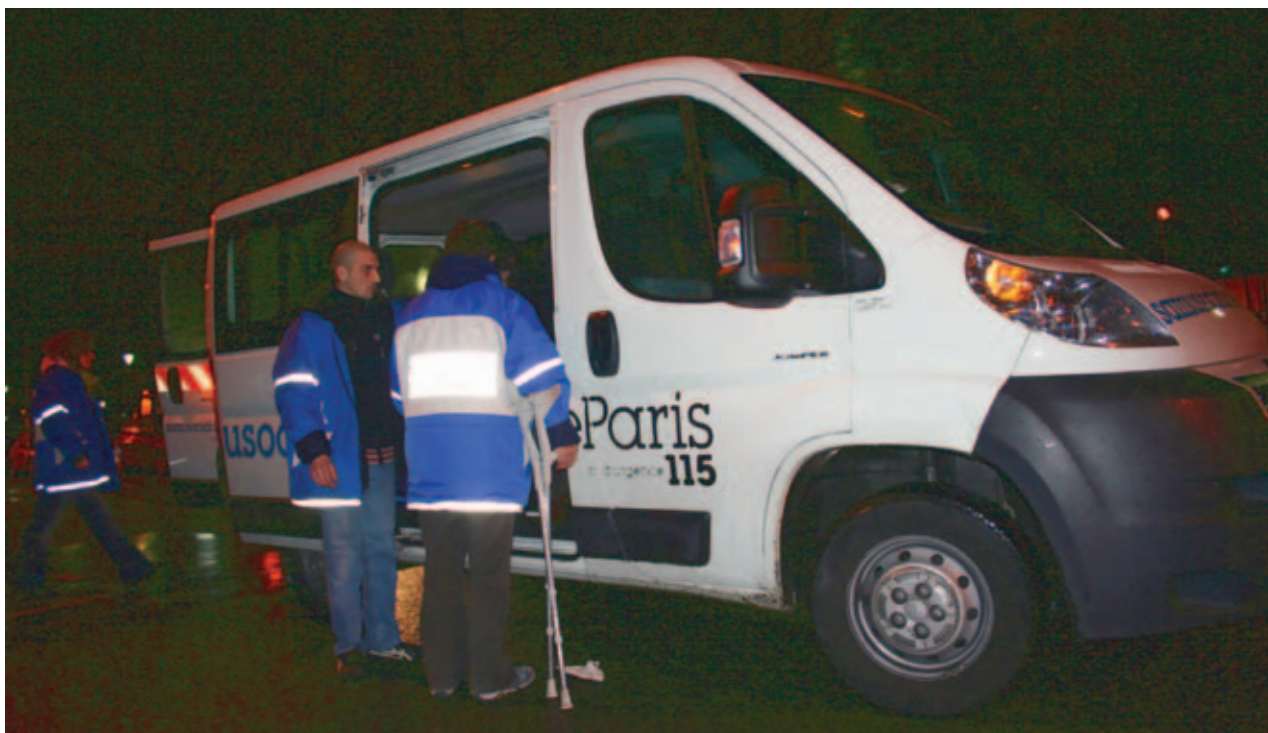
Бригада мобильной службы социальной помощи «Самюсосьяль» в Париже

автомобилей, в ближайшие 5 лет планируется увеличить автопарк до 50 машин и придать службе статус городской. По нашему предложению в структуре Московского городского штаба народной дружины была создана специализированная народная дружина по социальной безопасности. Сейчас в её составе более 400 человек, которые в каждом районе города выходят на улицы, ищут тех, кому нужна социальная помощь, дают правовые консультации, направляют в специальные учреждения.