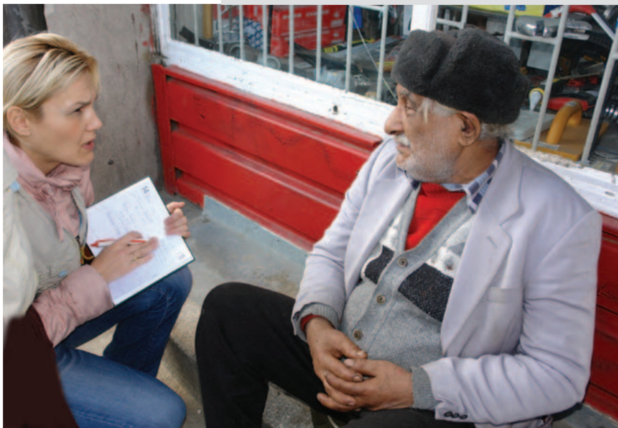
Социальный работник берёт на учёт бездомного (Париж)