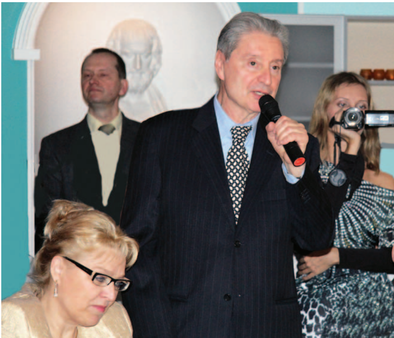
Председатель жюри Вениамин Смехов

на театральную тему, так что жюри оценивало не только внешнюю красоту, но и внутреннюю.