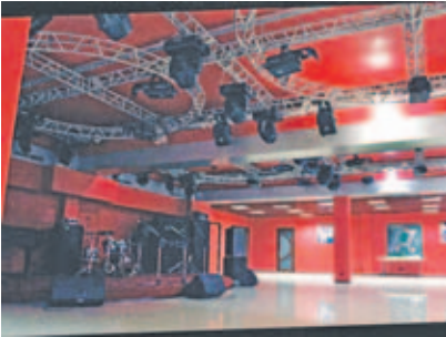
В студии «Инва Медиа ТВ»