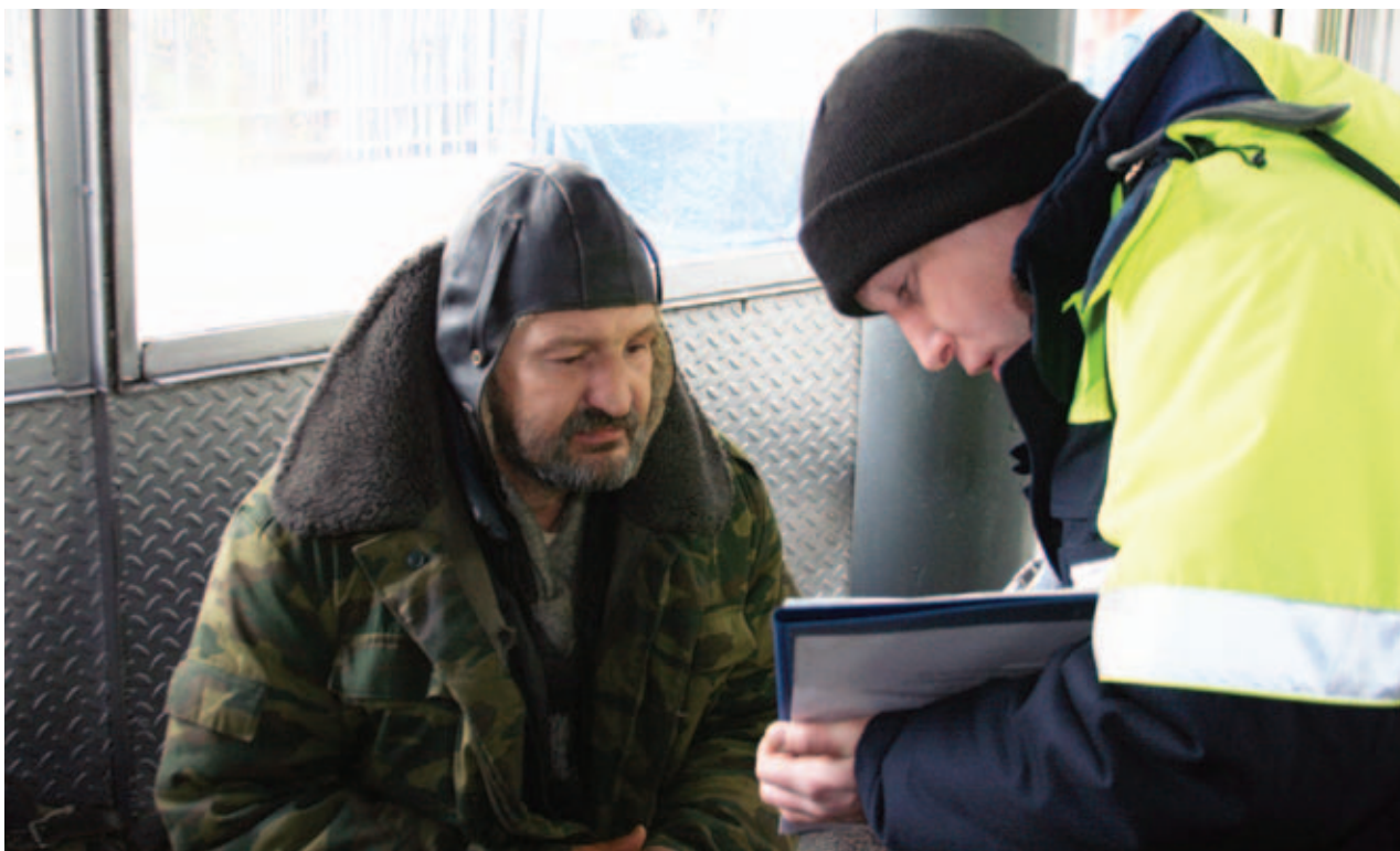
Социальный патруль в Московском метро

«Самюсосяль» существует не только в столице, но и во всех крупных городах Франции. Подобные структуры работают также в Брюсселе, Румынии, Лондоне, Мадриде, Болонье. И на сегодняшний день количество подобных структур, функционирующих по всему миру, растёт. Это мировая тенденция. В Европе нарастает количество бездомных. Это происходит за счёт притока мигрантов, за счёт пожилых людей, которые из-за маленьких пенсий не могут содержать дорогостоящие квартиры. Раньше во Франции проблемы пожилых людей решались при помощи их семей, когда молодые брали на себя заботу о стариках. Сегодня молодым всё труднее это делать, и семейная традиция заботы о стариках постепенно исчезает.