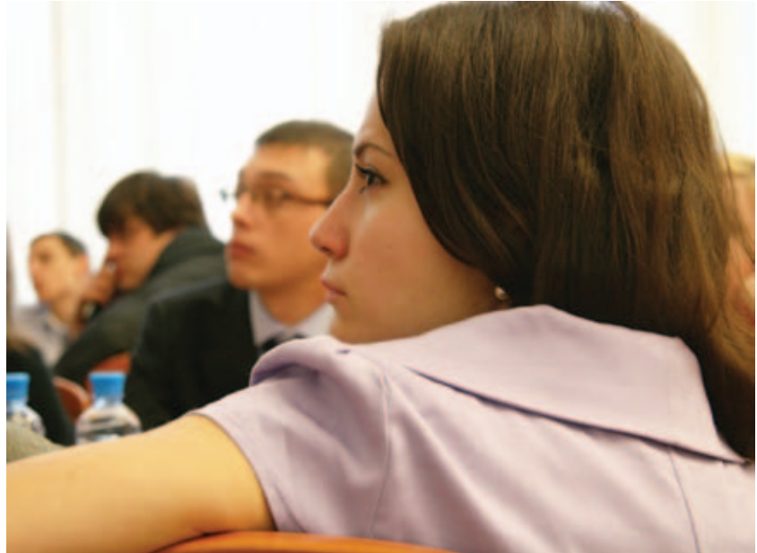
О Битве за Москву ребятам рассказали её участники

– Да, и это тесно связано с нашей молодёжной политикой. Например, проведённый РОО в Доме общественных организаций праздник для ветеранов труда организовывался и готовился совместно с Советом молодых специалистов. Вместе с молодёжью мы готовили и «круглый стол» «Помнит мир спасённый», посвящённый 70-й годовщине Битвы за Москву. О нём хочу сказать особо. «Круглый стол» состоялся в Московском Доме ветеранов войн и Вооружённых Сил. В его работе приняли участие Д.Т. Язов, Маршал Советского Союза, министр обороны СССР (1987–1991 гг.), участник