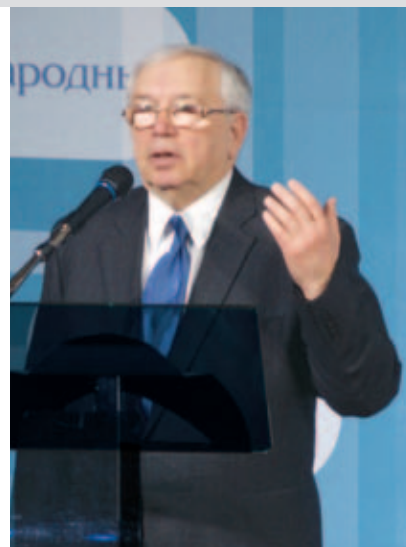
Президент Паралимпийского комитета России, уполномоченный по правам человека Владимир Лукин

Программы и передачи нового канала будут посвящены медицине и культуре, проблемам реабилитации и перспективе доступной среды, а также вопросам спорта и образования. А ежедневные новостные программы и ток-шоу с участием ведущих представителей сообщества людей с ограниченными возможностями здоровья сделают вещание не только полезным, но и интересным. Также телеканал будет транслировать передачи о трудоустройстве и образовании людей с инвалидностью. В сетку вещания обязательно будут включены «правовые часы», в ходе которых специалисты смогут проконсультировать и разъяснить за-