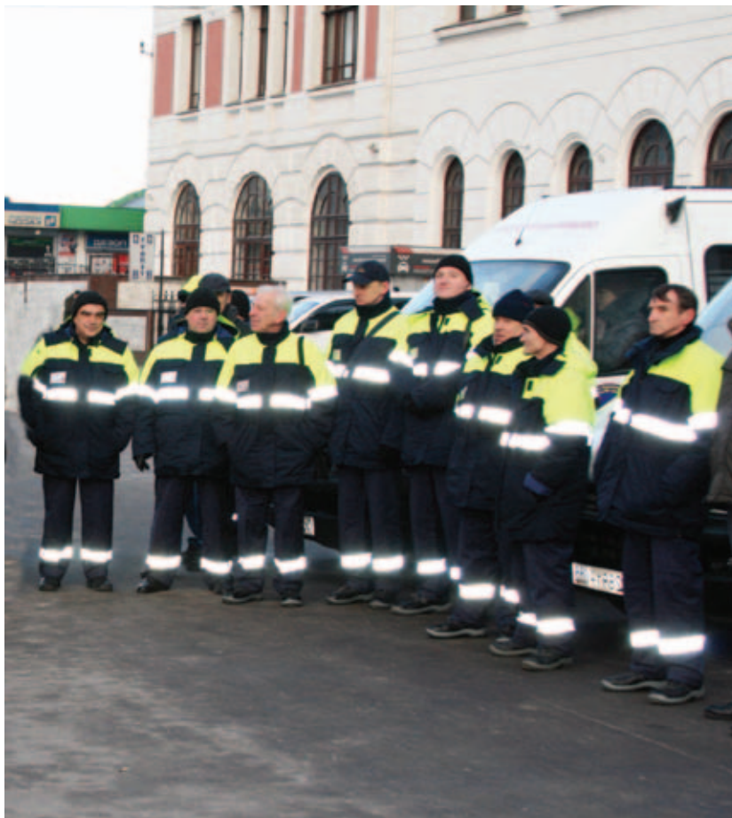
Бригады мобильной службы социальной помощи в Москве