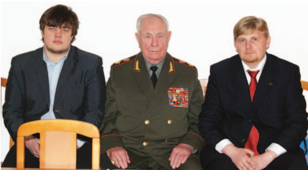
Маршал Д.Т. Язов с участниками «круглого стола»