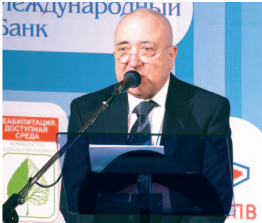
Президент первого социального телеканала «Инва Медиа ТВ», президент Паралимпийского комитета города Москвы Виктор Пруголо