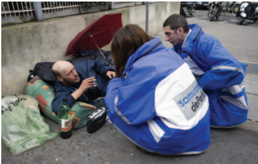
Работники службы «Самюсосяль» в Париже

торого есть медицинское образование, – медсестра или врач. Второй человек – шофёр, хорошо знающий город, помогающий установить контакты. Идея этой службы заключается в том, чтобы обнаруживать таких людей и оказывать им поддержку. Есть ночные и дневные бригады. Ночные работают в основном с бродягами. Дневные занимаются определёнными группами больных,