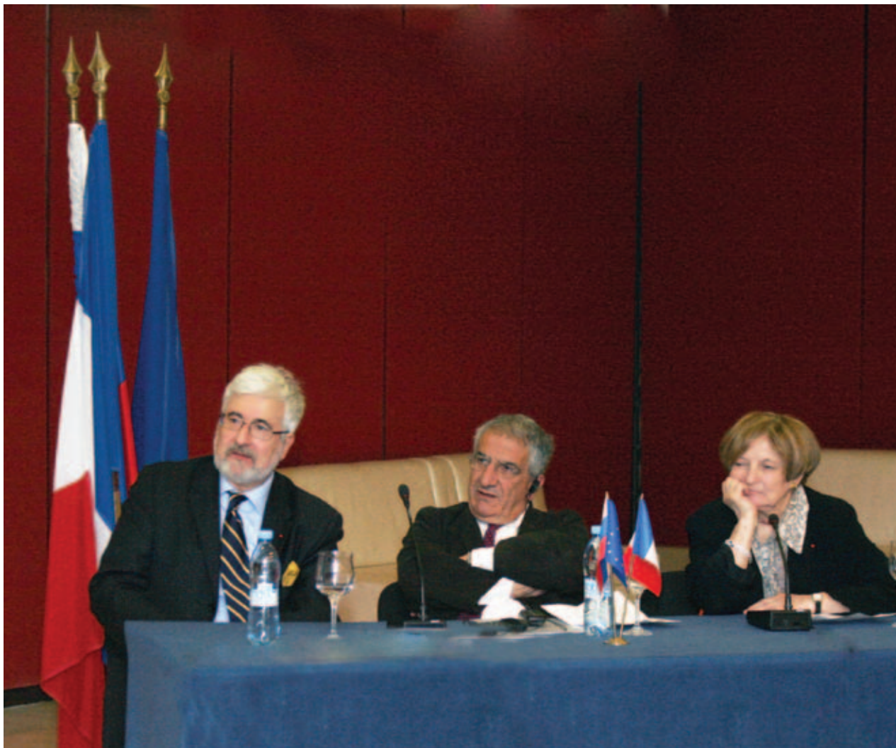
Посол Франции в России Жан де Глиниasti и президент Международного фонда «Самюсосьяль» Ксавье Эммануэлли

отметил Сергей Логунов. Он также выразил благодарность президенту Международного фонда «Самюсосьяль» Ксавье Эммануэлли и всем французским единомышленникам, делящимся своим опытом с российскими коллегами.